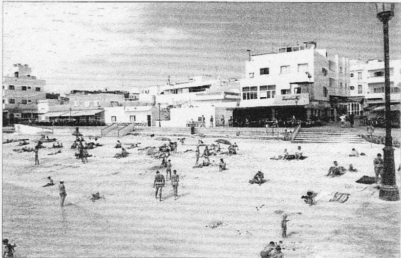
Los solares del casco antiguo de Corralejo, donde se asientan las casas de los vecinos, siguen siendo objeto de polémica. QUAYEDRA BRITO

Precisamente, este mismo solar fue objeto del tercer contrato, realizado el 9 de julio, donde se modificó el valor de la parcela, que subió a 200 millones, 20 a pagar a la firma del acuerdo y 180 cuando se hiciera público el documento. Se desconoce si se formalizaron finalmente las tres compras.